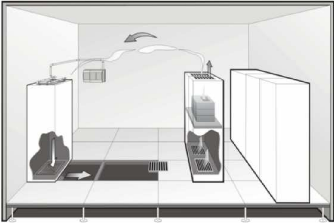
رسم بياني لنظام امتصاص الدخان